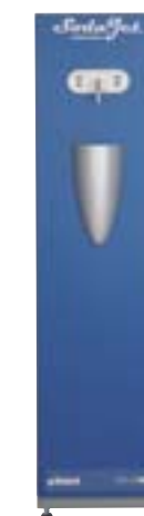
SODA JET Standard