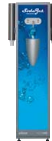
SODA JET Premium