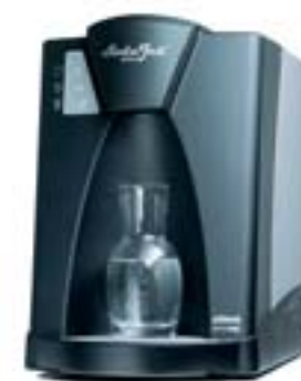
SODA JET OFFICE

In Betrieben, in Büros, in Kantinen, an Flughäfen, in Sportstätten, in Krankenhäusern, in Gemeindezentren, in ... – der SODA JET PROFESSIONAL ist ein Ort der Begegnung. Als Brunnen der Frische ist er ein Durstlöscher, den man gerne sieht und an dem man gerne gesehen wird.