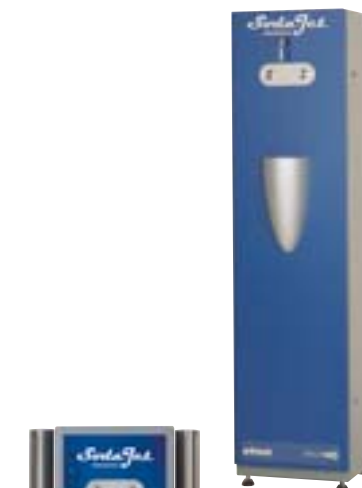
SODA JET Euro

Das Auge trinkt mit – jedenfalls beim SODA JET . Sowohl der SODA JET PROFESSIONAL als auch der SODA JET OFFICE sind platzsparend konzipiert und überzeugen durch ihr klassisch-modernes Design. Übrigens: Der SODA JET PROFESSIONAL steht in drei attraktiven Design-Varianten zur Verfügung. Als SODA JET Standard überzeugt er mit seiner robusten, pulverbeschichteten Stahlblechfront. Der SODA JET Euro bietet zudem zwischen Zapfstelle und Tropfenfänger ausreichend Platz, um handelsübliche 0,75-Liter-Wasserflaschen nach Euro-Norm zu füllen. Und beim Top-Modell SODA JET Premium kann eine auswechselbare, beleuchtete Frontfolie z. B. im Corporate Design Ihres Unternehmens oder zur Bewerbung Ihrer Produkte individuell gestaltet werden.